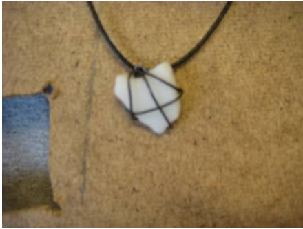
Hálsmen með slípuðu gleri úr fjörunni okkar

Hér má sjá ýmiskonar verkefni unnin úr efniviði fjörunnar t.d. hljóðfæri úr rekaviði, hálsmen úr steinum og myndaramma skreytta með skeljum.