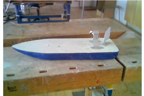
Rafmagnsbátur úr korki