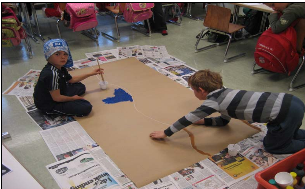
Unnið að verkefni á Umhverfisdegi.

Þema umhverfis dagana var: Nærsamfélag mitt, Njarðvík og Vallarheiði. Markmiðið er að nemendur verði meðvitaðir um umhverfi sitt, læri að skilja þá fjölmörgu þætti sem mótar samfélag og verði síðan virkir þátttakendur í mótun umhverfisins. Mikilvægt er einnig að nemendur velti fyrir sér af hverju eitthvað er eins og það er, ræði mögulegar ástæður fyrir því og finni úrbætur. Sem dæmi ef rætt er um eitthvað slæmt í umhverfinu eins og rusl og sóðaskap þá velta nemendur með sér ástæðunum fyrir sóðaskapnum. Þetta verkefni er í tengslum við þau umhverfismarkmið sem skólinn setti sér til tveggja ára haustið 2007. Einnig er skólinn í Comenicusarverkefni í tengslum við Leikskólann Gimli og leik- og grunnskólar frá Ítalíu, Spáni, Whales, Frakklandi og Ungverjalandi. Umhverfis dagurinn snérist um að láta alla nemendur skólans vinna sama verkefnið þ.e.a.s. allir nemendur fá sama viðfangsefnið gefið upp sem þeir útfærðu síðan á misjafnan hátt í samráði við sinn umsjónarkennara.