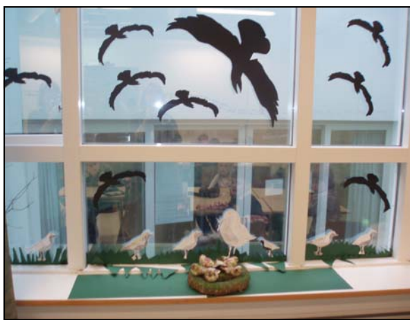
Listaverk um fugla eftir nemendur á yngsta stigi.

Síðasta skólaár er búið að vera viðburðaríkt. Það sem stendur þó upp úr er að við náðum þeim áfanga að fá Grænfánann afhentann við formlega athöfn 20. nóvember 2007. Mikil vinna var lögð í umsókn og matsskýrslu sem send var inn til Landverndar. Við fengum einnig fulltrúa frá þeim í heimsókn sem skoðuðu skólann og starfsemi okkar í umhverfismálum. Umhverfisráð skólans hittist 10 sinnum á skólaárinu. Nemendur í þessu ráði unnu að hugmyndavinnu í sambandi við umhverfisgát í skólanum og bjuggu til slagorð og áminningar sem þau settu upp í hverri skólastofu ásamt matsalnum. Þau undirbjuggu skoðanakönnun sem send var heim með nemendum. Þau komu einnig saman til þess að skrifa undir umhverfissáttmála skólans sem hangir uppi í hverri skólastofu og er áberandi öllum þeim sem inn í skólann koma. Þeir nemendur sem voru í umhverfisráðinu í vetur verða þar áfram næsta vetur nema hvað nemendur 10. bekkjar falla út og nýir 5. bekkingar koma inn í staðinn. Á þemadögum í skólalok var áhersla lögð á grenndarkennslu og endurvinnslu. Þetta voru vel heppnaðir dagar þar sem nemendur unnu margvísleg verkefni og m.a. bjuggu til kerti úr kertaafgöngum sem safnað hafði verið allt skólaárið. Kennara og starfsfólk unnu í vetur samkvæmt umhverfissáttmála Njarðvíkurskóla og var það með svipuðu sniði og verið hefur síðustu ár m.a. með grenndarkennslu, þrif á skólalóð, endurvinnslu pappírs og endurnýtingu annarra hluta.